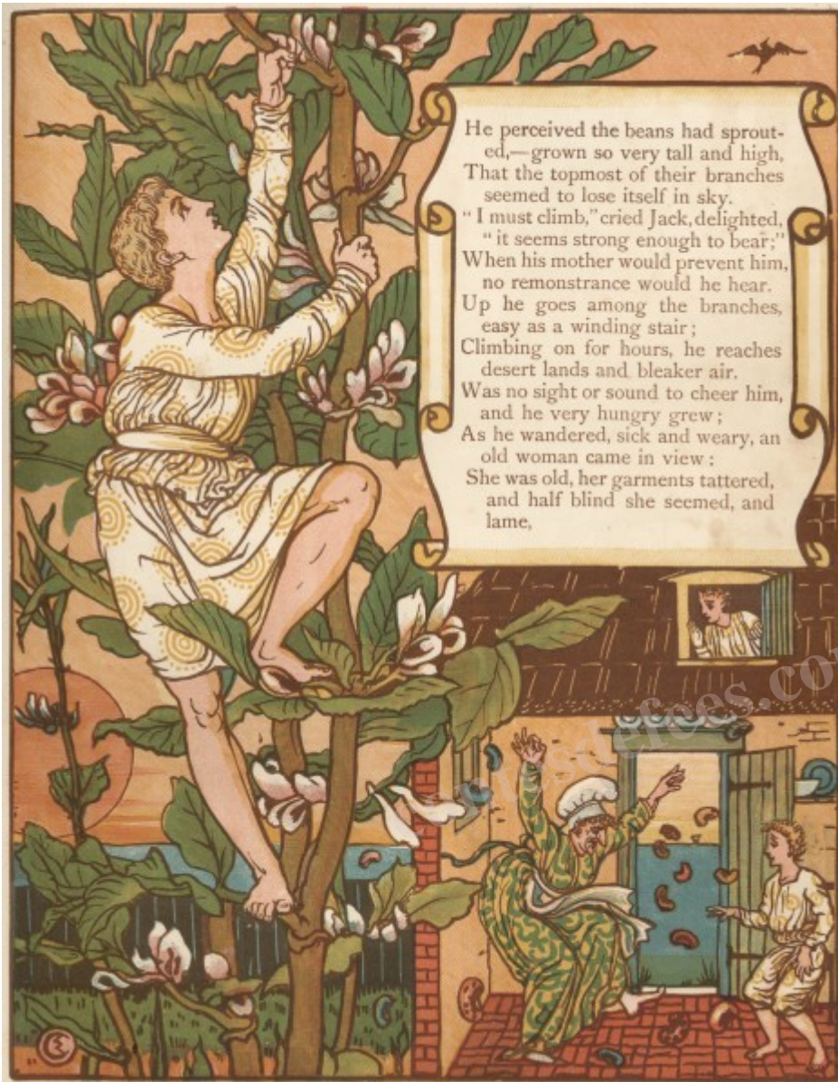
Jack et le Haricot Magique – Illustration de Walter Crane

Il marcha jusqu'au château et découvrit que c'était la maison d'un couple de géants, car les portes et les meubles étaient gigantesques. Dans la cuisine, il trouva la femme géante et lui demanda: