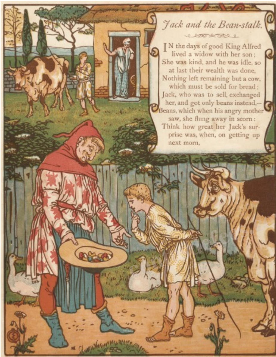
Jack et le Haricot Magique – Illustration de Walter Crane

Sa mère se mit en colère en voyant les haricots et pensa que son fils s'était fait berné par le vieil homme.