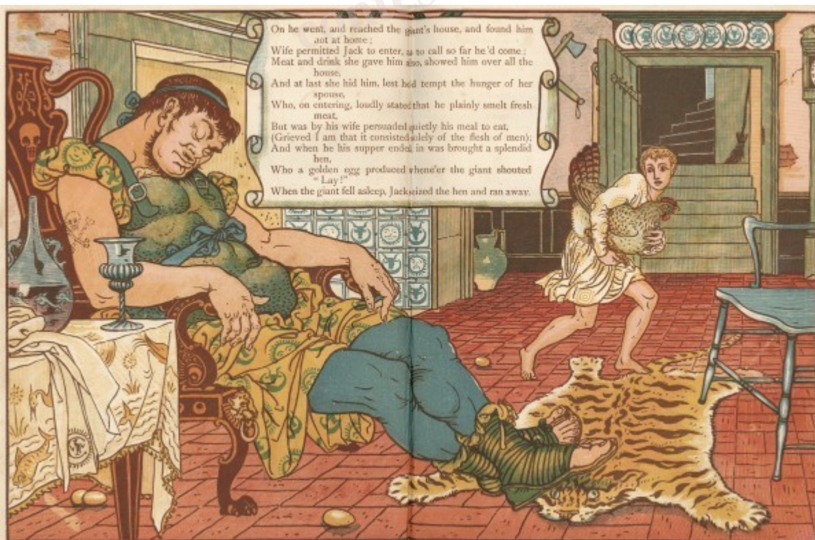
Jack et le Haricot Magique – Illustration de Walter Crane

Satisfait et repu, le géant s’endormit pour sa sieste.