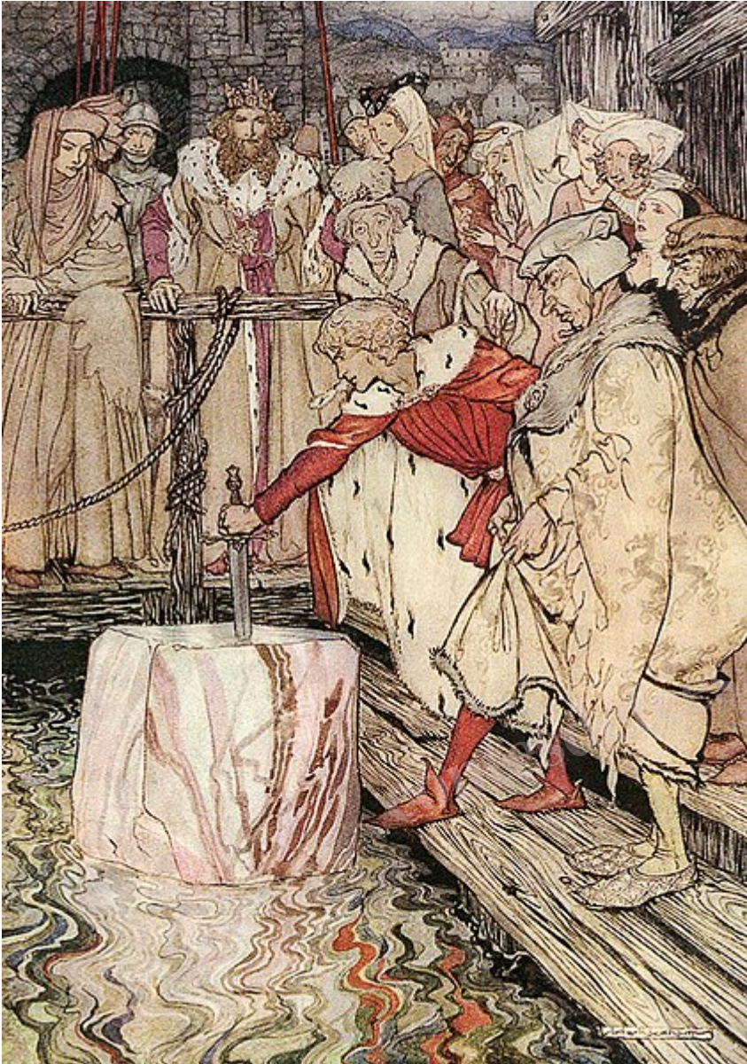
The romance of King Arthur and his knights of the Round Table. Abridged from Malory's Morte d'Arthur by Alfred W. Pollard. Illustrated by Arthur Rackham. Published 1920 by Macmillan in New York.