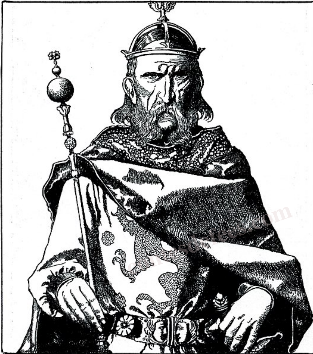
Uther Pandragon par Arthur Pyle

Mais lorsque Uther Pendragon et la duchesse Igraine croisèrent leurs regards, le roi tomba éperdument amoureux d'elle. Il était tellement fou amoureux qu'il demanda au magicien de la cour, Merlin l'enchanteur, de lancer un sort. Ce sort consistait à faire croire à Igraine qu'Uther était son véritable mari. Et cela fonctionna tellement bien qu'ils s'unirent et de leur union naquit un fils nommé Arthur.